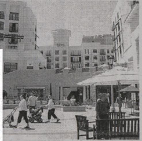
「パンビレッジ」上層階がアパートとなっている

4%と白人の39・1%に次いで多く、アフリカ系の14・0%、アジア系の9・9%と続く。人口は