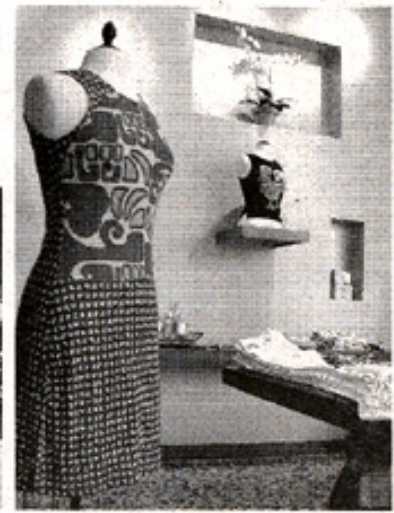
アートギャラリーのような店内

*は California Assoc. Department of Justice